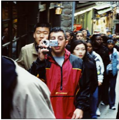
Entre deux mondes

La série de photographies propose un parcours au cœur de ces instants discontinus et confrontés, entre rues vives et portes d'abbaye, entre langues étrangères et silence monastique.