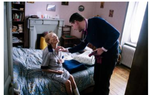
Médecin de campagne

Tant qu'il y aura des médecins de campagne... » conclut Denis Bourges