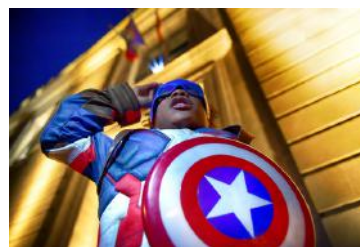
Captain et l'instinct de protection

Reconduit depuis plusieurs années, le concours Les Biévrois aiment la photo permet de réaliser une exposition dans les rues de la commune autour de la mairie et en centre-ville. Il a pour objectif de valoriser les photographes de la commune pendant la Foire. Il est ouvert à tous les photographes biévrois, aux membres des associations de photographes de Bièvres et à ceux qui travaillent à Bièvres. Les photos sélectionnées seront exposées entre le 19 mai et le 8 juillet.