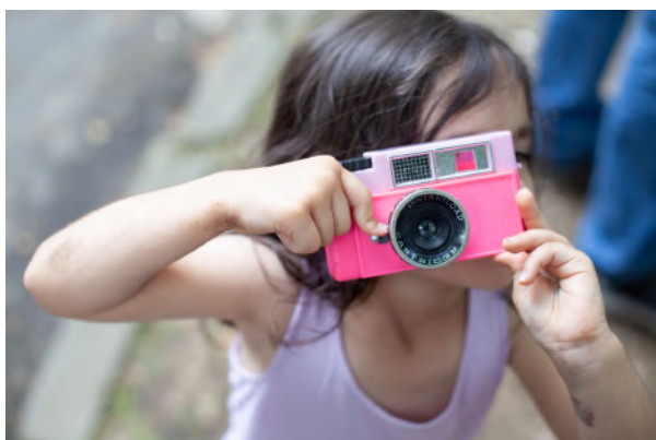
Gotcha © Caroline Austin – Lauréat portrait individuel ou collectifs du public de la Foire

Date limite d'envoi des photos dimanche 16 juin à minuit : concours@foirephoto-bievre.com Règlement du concours sur le site de la Foire.