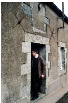
Médecin de campagne