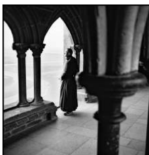
© Denis Bourges/ Tendance Floue – Entre deux mondes

Co-fondateur et membre du collectif de photographes Tendance Floue , il observe les sociétés dans les huis clos. À ses débuts, il voyage en Inde, son terrain de prédilection, où il réalise plusieurs séries. Il part ensuite pour Jérusalem où il interroge les cloisonnements, réels ou symboliques, qui divisent la ville. Puis il suit la dernière année d'activité professionnelle de son père, médecin de campagne en Bretagne, ainsi que son successeur. Ces dernières années, il travaille sur un ensemble intitulé Entre deux mondes , s'attachant à faire apparaître des univers qui cohabitent sans se voir.