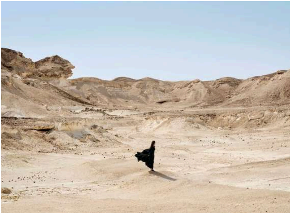
© Laura Bonnafous dédicacera son livre Souffle aride

Il offrira quelques tirages pendant la Foire.