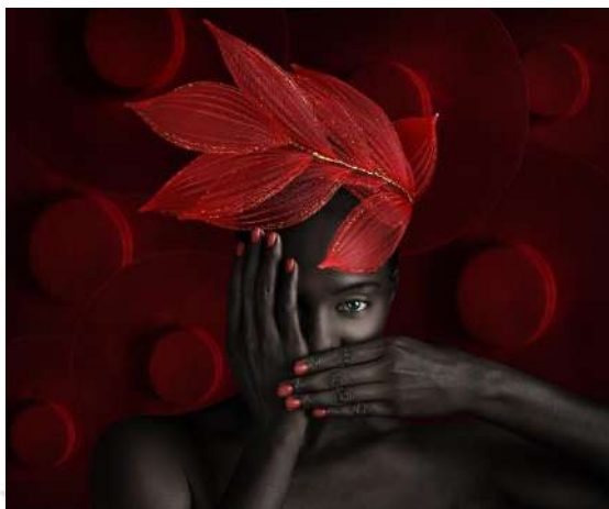
Black woman – Macao – Salon Daguerre 2024

La série est intitulée Carpaccio car pour pouvoir observer les fruits et les légumes photographiés en semi-transparence, la lumière doit pouvoir passer en partie à travers, ce qui oblige Arnaud Vareille à les couper en tranches assez fines en général. C'est un travail d'exploration des formes, des textures, des couleurs.