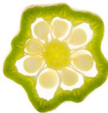
Série Carpaccio – Gombo – Exposition au Mille Feuilles