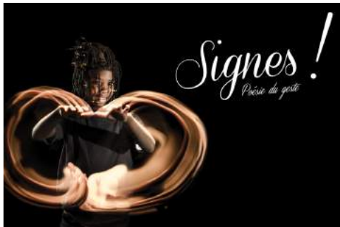
© Jean-Michel Molina et Grégory Bozec