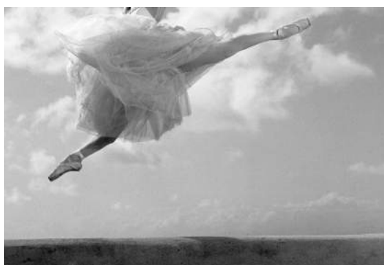
© Isabel Muñoz- Série Ballet nacional de Cuba, 2001

Elle sait capter les chairs, les formes, les postures,